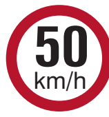
RUS 039 to 044

RUS 039 = 120km/h RUS 040 = 100km/h RUS 041 = 80km/h RUS 042 = 60km/h RUS 043 = 50km/h RUS 044 = 30km/h